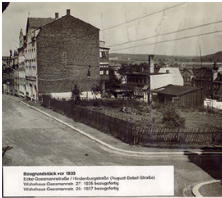
Baugrundstück vor 1935 Ecke Goesmannstraße / Hinderburgstraße (August-Bebel-Straße) Wohnhaus Goesmannstr. 27: 1926 baufertig Wohnhaus Goesmannstr. 25: 1927 baufertig

Fotos: Goesmannstr. 25-27 vor Baubeginn und heute