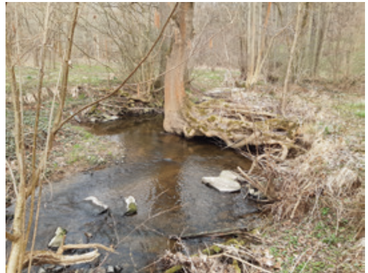
Foto: Dieser Baum ist ein perfekter Unterstand für Fische und kann vor Fressfeinden schützen und im Sommer Abkühlung bringen

Dieser Text entstand in Zusammenarbeit der Fachberaterinnen und Fachberater Gewässer des Landesamtes für Umwelt, Landwirtschaft und Geologie und der unteren Wasserbehörde des Landkreises.